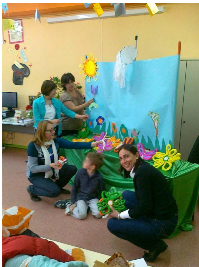
PREPARANDO UN GUIÑOL JUNTO A LAS MAESTRAS.