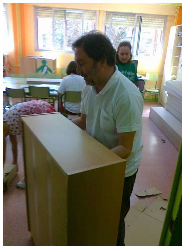
“El Secretario del cole demostrando su fuerza”