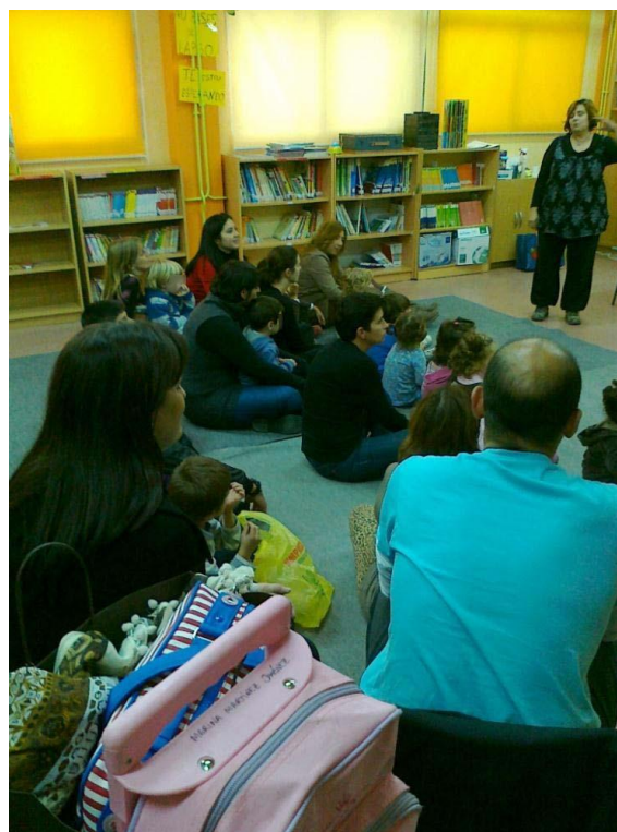
TARDE DE CUENTACUENTOS