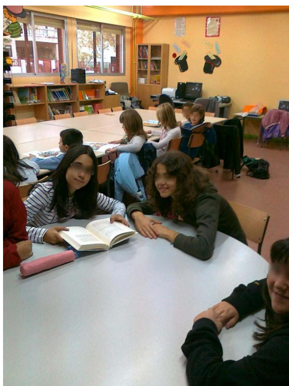
LAS TARDES DE LA BIBLIOTECA