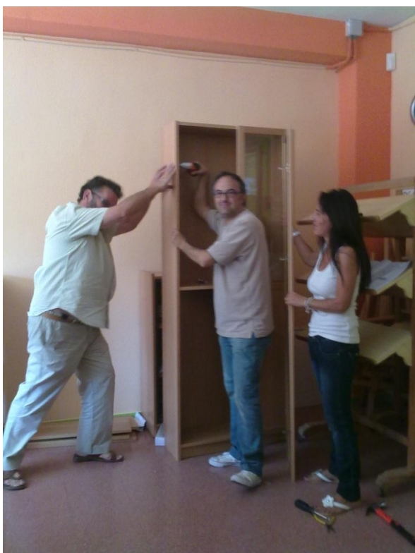
El director también colabora